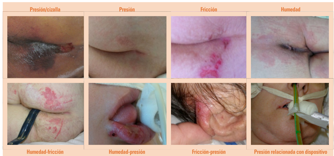
Figura 1. Fotografía representativa de cada uno de los tipos de lesión identificados.

LESCAH: lesiones cutáneas asociadas a la humedad; UPP: úlceras por presión.