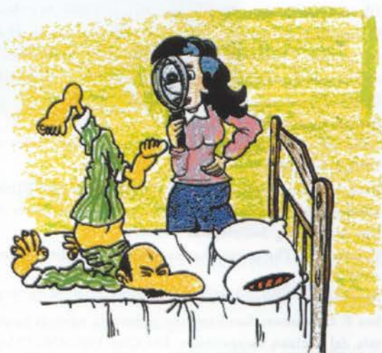
Fig. 1. Dibujo y texto de la página 5 de la Guía en la que se aconseja la realización de cambios posturales como una de las actividades básicas en la prevención de las úlceras por presión. (Dibujo realizado por Manolo Palma).