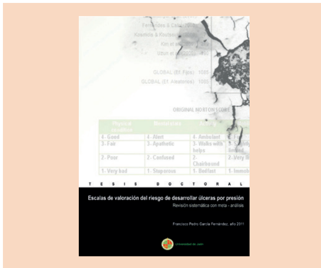
Figura 1. Tesis doctoral donde aparece por primera vez el modelo teórico de las lesiones cutáneas relacionadas con la dependencia.